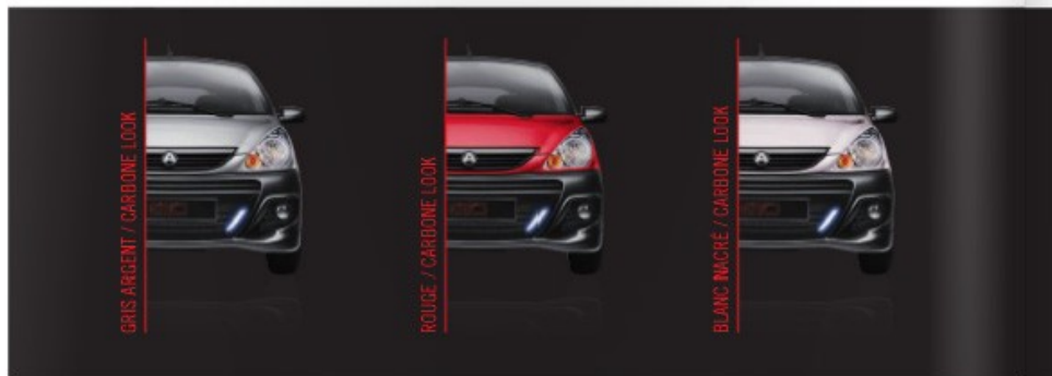
GRIS ARGENT / CARBONE LOOK